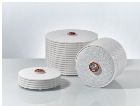
Permeabilidad al agua gama BECODISC BT

Filtración de pulimento de disoluciones azucaradas concentradas con aprox. 65 °Brix así como filtración de aceite comestible, extractos vegetales, caldo de gelatina, bases de pomadas de productos básicos, aceites, barnices, dispersiones de polímeros y separación de arcilla decolorante. Otro ámbito de aplicación es la precipitación por carbono activo. Según la repartición granulométrica del carbono activo, la precipitación es posible incluso como filtración fina de una sola etapa.